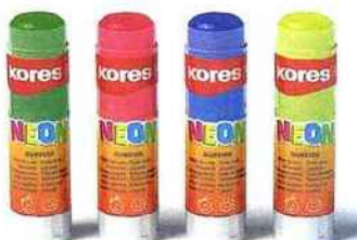
Les quatre couleurs de colle des tubes Neon pour coller et décorer à la fois.

école existe en collage normal ou fort et en 60 g ou 120 g,