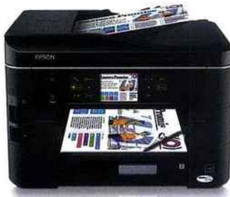
L'Epson Stylus Office BX925FWD avec écran tactile bénéficie d'un double bac papier pouvant contenir jusqu'à 500 feuilles A4.