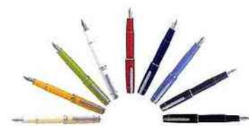
Classique ou flashy, Prera est un accessoire de mode qui prouve que le chic est une affaire de détails.