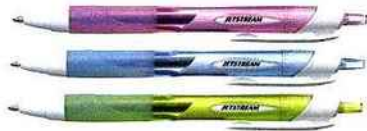
Trois nouvelles couleurs flashy pour le Jetstream Sport qui conserve son encre noire quelle que soit la couleur du corps.

Le nouveau roller Jetstream Sport est rétractable, rechargeable et très tendance avec son design fun et sport aux couleurs flashy rose, bleue ou jaune. Il