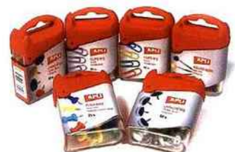
Apli-Agipa élargit sa gamme d'accessoires de bureau avec six nouvelles références.