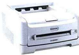
La vitesse d'impression en recto verso devient un critère majeur de choix du produit.

Dotées des dernières technologies et d'un design sobre et élégant, elles offrent de très hautes qualité et vitesse d'impression : 24 ppm en «simplex» et 16 ppm en «duplex», ce qui en fait la gamme d'imprimantes recto verso la plus rapide sur ce segment de marché. La fonction «toner save» permet de diminuer la quantité de toner utilisée