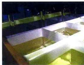
De nouvelles colles thermofusibles auto-adhésives destinées aux étiquettes et aux emballages.

Dans le secteur des colles auto-adhésives, c'est le groupe des colles thermofusibles auto-adhésives qui s'est naturellement imposé. Il s'agit de colles Hot Melt à base d'élastomères thermoplastiques de synthèse possédant des propriétés auto-adhésives permanentes. Elles constituent une alternative aux colles à dispersion aqueuse auto-adhésives et aux colles