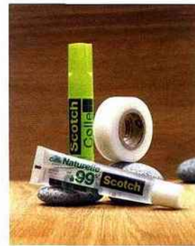
Des produits fabriqués à partir de matières naturelles pour un plus grand respect de la nature.

Le ruban adhésif Magic™ Scotch® est constitué de fibres naturelles (certification FSC), d'un adhésif à base d'eau, sans solvant, d'une bague centrale