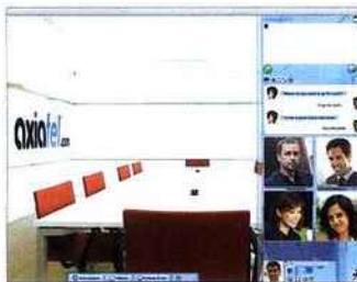
Lancée en 2008, Axiatel.com est la première plate-forme de vente en ligne de solutions télécoms. Le site dispose d'une large gamme de services pour les professionnels : fax par mail, standard vocal virtuel, visio-conférence et conférence call.