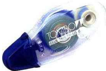
L'applicateur PN-US pour coller simplement et proprement.