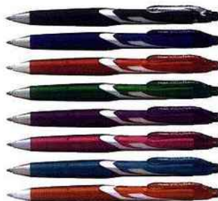
Le corps de Vicuña est à la couleur de l'encre qu'il contient.

Vicuña est un stylo bille rétractable et rechargeable à l'écriture très douce grâce à son encre à pigments à faible viscosité et résistante dans le temps. Son grip caoutchouc et son embase striée apportent un grand confort